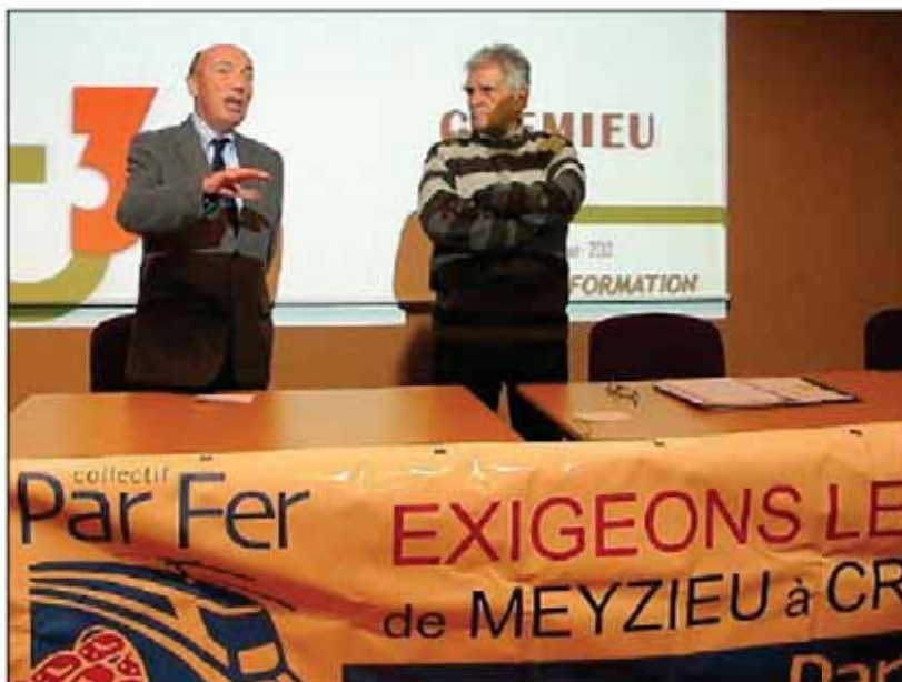
Le collectif Parfer dispose notamment du soutien d'Alain Moyna-Bressand, député de la 6 e circonscription. Des réunions sensibilisent régulièrement les citoyens. La prochaine aura lieu le 15 février à Pont-de-Chéry.

Collectif parfer : lcparfer@gmail.com www.parfer-lyon-cremieu.org Prochaine réunion le 15 février à Pont-de-Chéry, en mairie, à 19 heures.