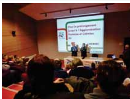
3e réunion d'information : CREMIEU le 24 janvier 2013, Salle Audio

Les intervenants du Collectif PARFER LYON <=> CREMIEU ont insisté sur le rôle structurant du tram sur le développement de l'habitat et l'implantation de nouvelles entreprises, précisant que le tram ne ferait qu'accompagner l'augmentation de la population qui était prévue par les élus lors de l'élaboration des documents d'urbanisme (SCOT du territoire et PLU des communes).