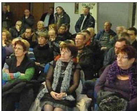
Une nouvelle fois, il y avait du monde vendredi soir à la réunion publique. Signe que la population est préoccupée par le projet de création d'une liaison rapide vers Lyon. Une pétition avait déjà recueilli 11 000 signatures.

La création du syndicat mixte des transports pour l'aire métropolitaine lyonnaise, inclut « notre territoire ». Il doit permettre d'assurer la coordination, d'identifier les besoins de réseaux nouveaux. « Mais on suit l'évolution, on ne reste pas les deux pieds dans le même sabot. » □