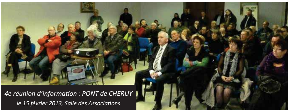
4e réunion d'information : PONT de CHERUY le 15 février 2013, Salle des Associations

Les intervenants du Collectif PARFER LYON⇔CREMIEU ont insisté sur l'importance de la mobilisation de tous (élus, population, entreprises) pour que la solution prolongement du tram T3 soit retenue à l'issue de l'étude qui doit démarrer très rapidement.