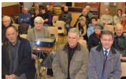
2e réunion d'information : CHAVANOZ, le 18 janvier 2013, Maison des Associations