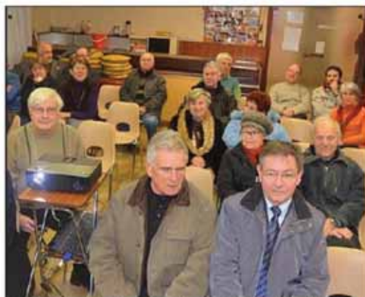
Devant une trentaine de personnes, le collectif Parfer a défendu le projet de prolongement du tram T3 de Meyzieu ZI jusqu'à Crémieu. La meilleure alternative selon ce collectif, soutenu par 1300 sympathisants.

Le collectif Parfer Lyon/Crémieu est créé en 2001 à la suite de la décision du conseil général du Rhône de réutiliser l'emprise du CFEL (Chemin de fer de l'Est de Lyon). Son objectif : faire prolonger jusqu'à Crémieu la ligne de tramway qui devait être réalisée sur le Rhône. Il est pour une solution fermée comme le demande la population. 1300 sympathisants le soutiennent. Il est animé par un bureau composé d'une vingtaine de personnes. Apolitique, il tente de trouver un consensus.